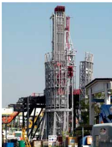
Мобильная буровая установка Drillmec HH 200

– При выполнении программы эксплуатационного бурения на Астраханском