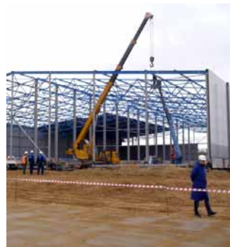
Строительство Амурского ГПЗ, май 2017 года

Локализация производства теплообменников на территории России стала возможной благодаря тесному взаимодействию Газпрома, Linde и отечественных машиностроителей.