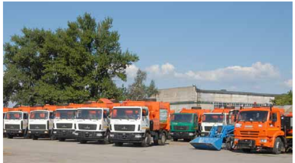
Региональный оператор «ЭкоЦентр» оснащает астраханский регион новой коммунально-уборочной техникой, контейнерами и бункерами

А Федеральный закон от № 175-ФЗ окончательно закрепил, что обращение